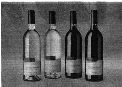
Alliance Loire guide le consommateur à travers une multiplicité de goûts, d'arômes frais et fruités, de robes et de couleurs.

Grosse année pour la coopérative Alliance Loire, qui lance treize nouvelles gammes sur les marchés de la grande distribution. Le concept ? Décliner la richesse des terroirs du Val de Loire en cinq « styles » répondant aux goûts et budget des consommateurs. Exemple avec « Parfum de cépages », gamme réservée aux néophytes, curieux de découvrir de nouveaux arômes. Une manière pédagogique d'associer la notoriété de l'AOC à l'univers sensoriel du cépage (moins de 5 euros).